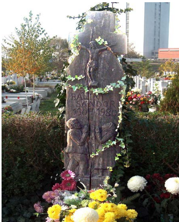
Bálint Sándor síremléke