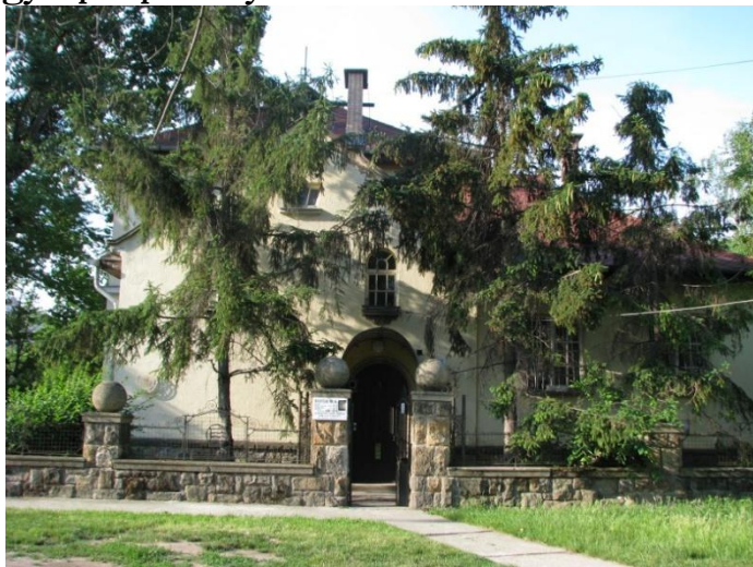
A plébánia ma