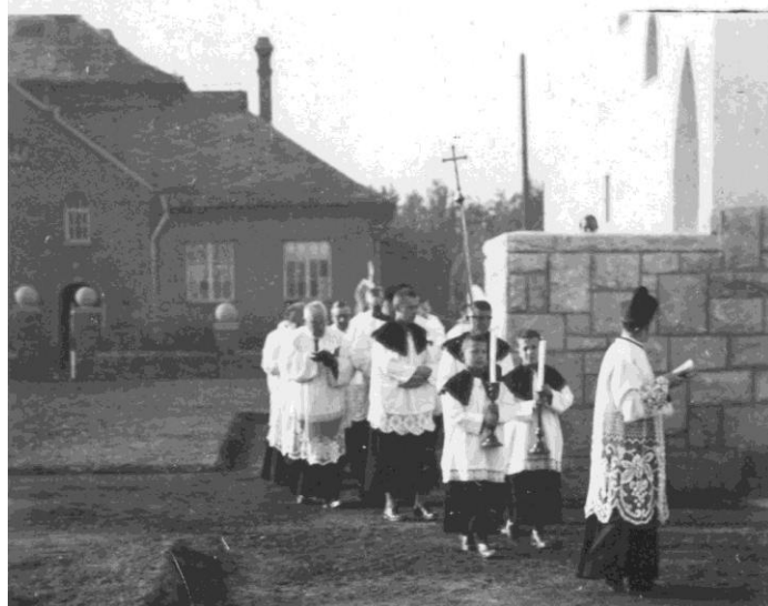
Templomszentelés 1941-ben.

én szentelt fel Shvoy Lajos megyéspüspök Szent Mihály arkangyal tiszteletére.