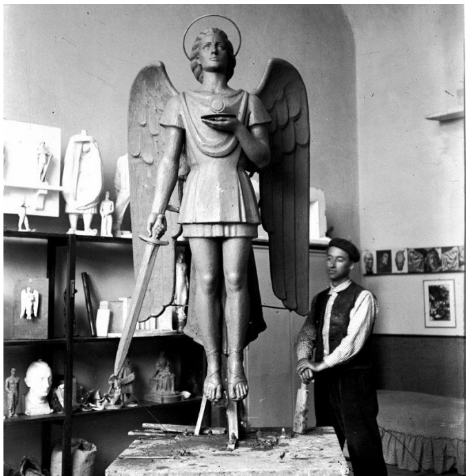
A Szent Mihály-szobor még a műteremben