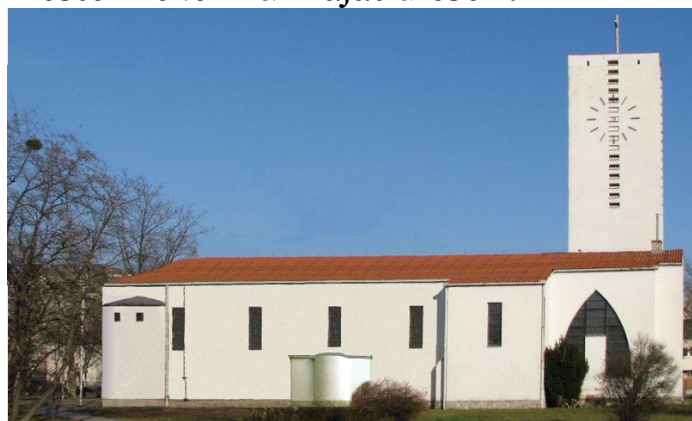
Templomunk ma