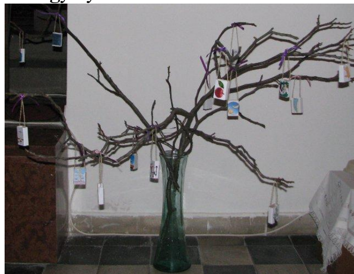
Minden nap az adott naphoz kapcsolódó jelkép kerül fel a fára

fájának neveztük el. A templomban is van egy ilyen fa: