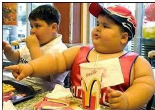
Hála Istennek, hogy nem vagyunk katolikusok!

– Rabbi, nem tehettem mást! Az egész városban jóm kippur böjtje volt, és minden zsidó étterem zárva tartott!