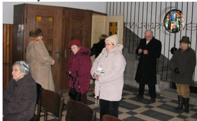
Lelki előkészület és gyónás szombaton

A szentség a Szentlélek kegyelmét adja a betegnek. Felszítja bizalmát. Megerősíti a kísértések és a halálfélelem ellen. Ha szükséges, megadja bűnök bocsánatát, és tökéletessé teszi a keresztény bűnbánatot.