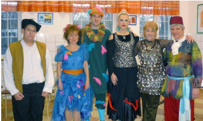
A Varázsfuvola előadása.