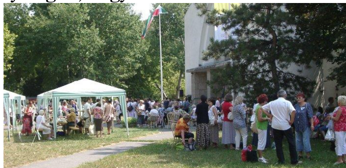
Aki nem fért be a templomba, a templom előtt kapott helyet sátrak alatt

Majdnem 700 fő érkezett szombat reggel az ország távoli pontjairól, hogy együtt imádkozzanak gyermekeikért, az ifjúságért, hogy ne veszítsék el hitüket.