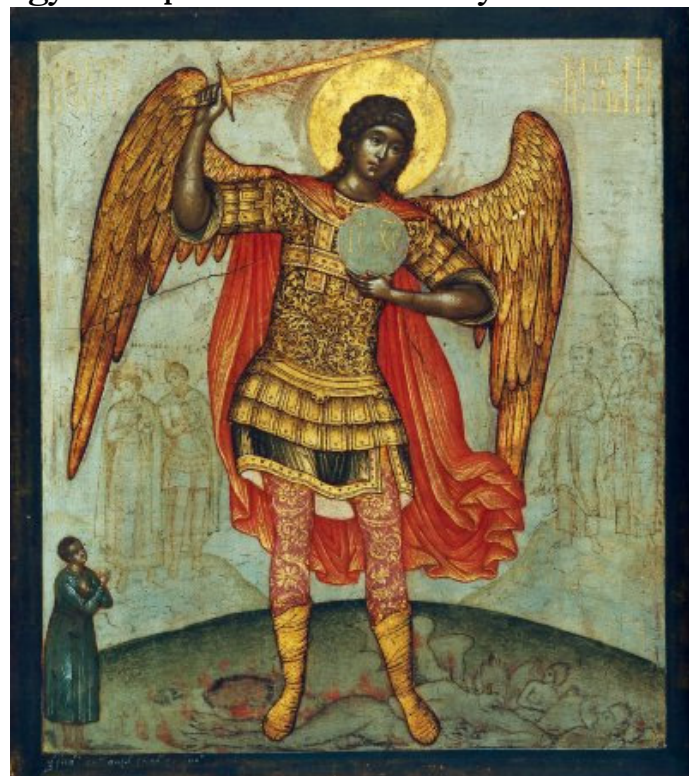
Szimon Usakov festménye, 1676

Megszentelt helyek a Fertő-táj Világörökség templomai közül a hegykői Szt. Mihály templom. A szentély közepén Szt.