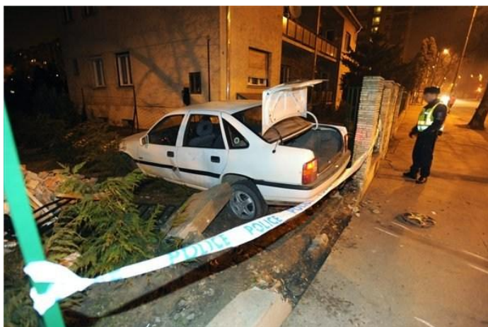
Pusztítás az Albertfalva utcában

Múlt szombat éjjel, nem sokkal azután, hogy hazaértem a budafok-felsővárosi farsangi bálról, éktelen motorbőgéssel egy autó húzott el az ablakom alatt. Felkaptam a fejemet, kinéztem, hogy ki lehet ez az állat, de csak egy villanásnyira láttam. Az erkélyajtóhoz szaladtam, hogy legalább utána nézzek, ki tép ennyivel kis utcánkban, a fekvő rendőrökön keresztül, de már csak a csattanást láttam.