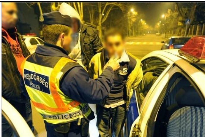
23 éves, egy darabig legfőljebb csak rabszállítóban fog ülni

2006 óta a sündörök nincsenek a szívem közepében, de meg kell adni, ezt úgyesen csinálták. Amiatt, hogy nem kapták el üldözés közben, egy csöppet sem hibáztatom őket, ez nem egy amerikai film volt, hanem a magyar rögválóság. Viszont nem sérült meg senki, még a rendőrautókat sem törték össze (pedig szokták). Az pedig, hogy egy fontos ügy miatt pillanatok alatt össze tudnak rántani 10-15 rendőrt, aki egyetlen bűnözőt üldöz, a rendőrség ütőképességét mutatja. Azt is meg kell jegyezni, hogy mióta Bató András a levelet írta a kerületi kapitánynak, sűrűn látjuk errefelé a járőröket, akik valóban élénk érdeklődéssel figyelik templomunk környezetét.