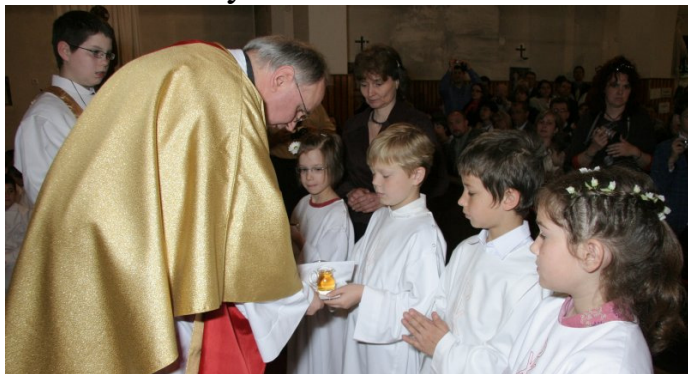
Az oltárhoz hozzák az áldozati adományokat

lyen csodában van részük és kívül találkoznak az ostya és bor színe alatt.