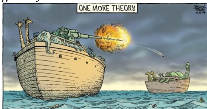
Még egy elmélet

– Ezt te csak gondold! – szállt vele vitába egyik társa – Hiszen összesen két gilisztája volt!