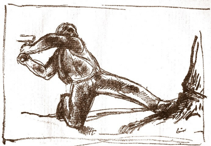
Szőnyi István: Favágó

Az erdőben egymás mellett dolgozott két favágó. A fák törzseinek hatalmas volt az átmérője. Sokat kellett dolgozni a fakitermeléssel. Mindketten egyformán jól kezelték a fejszét, de a munkamódszerük nem egyezett: az első kintartó munkával vágta a fába fejszéjét, egyiket a másik után. Ritkán és akkor is csak rövid szünetet tartott. A másik favágó óránként hosszabb pihenőre megpihent.