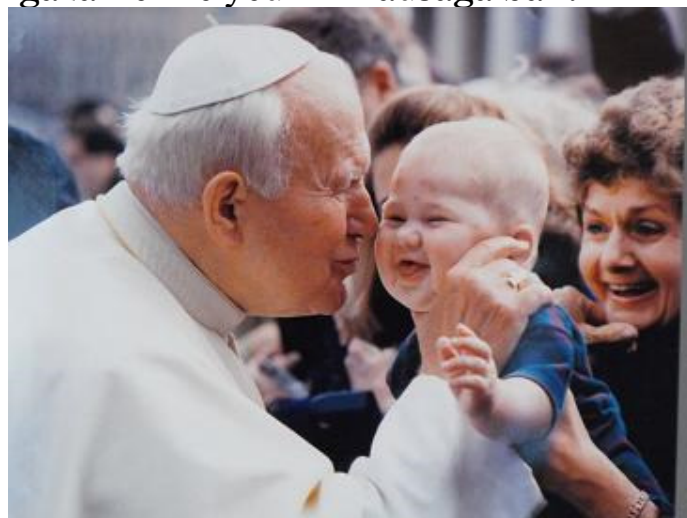
II. János Pál pápa és a gyerekek

Kiemelendő a természet iránti szeretete. A szerző elmondása szerint itt a hegyek között, az erdők mélyén tudott igazán elmélyedni imádságaiban.