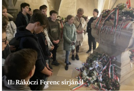
II. Rákóczi Ferenc sírjánál

Másnap reggel gyorsan megreggeliztünk és már útnak is indultunk, hogy felkeressünk egy helyi borászt, aki mesélt a gyümölcsstermesztés rejtelemiről. Megkóstolhattuk egyik speciális gyümölcslevét, amiben szamóca és alma volt. Mindenkinek nagyon ízlett, de tovább kellett mennünk, mert vártak minket a rimaszombati iskola magyar diákjai.