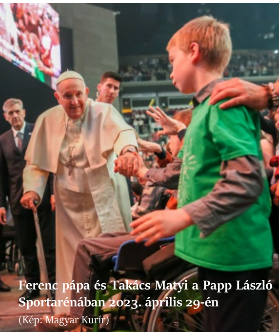
Ferenc pápa és Takács Matyi a Papp László Sportarénában 2023. április 29-én