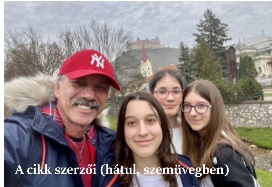
A cikk szerzői (háttul, szemüvegben)

Amikor beléptünk, érdekes volt látni a velünk egykorú diákokat, és hogy hogyan élik mindennapjaikat egy másik országban. Miután megmutatták az iskolájukat, tovább mentünk a református templomba. Ez nekünk egy érdekes program volt, hiszen mi katolikusként ritkán látunk ilyet. Egy református lelkész előadást is tartott, ami több szempontból is megérintett minket. Itt még megnéztük Tompa Mihály és Petőfi Sándor szobrát is. A betléri Andrásy-kastély felé vezető úton az énektanárunk vezetésével közös éneklésbe kezdtünk.