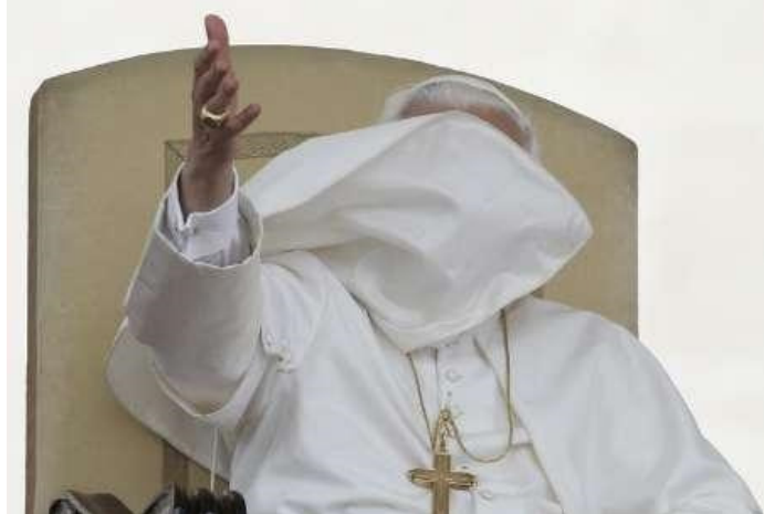
A sok támadás lassan eltakarja az emberek előtt a pápa igazi arcát

Igazából nem kellene megdöbbennünk ezen a kampányon, hiszen mindig is a Katolikus Egyház és a pápa volt és lesz az istentelen erők fő ellensége. De mégis fel kell emelnünk a szavunkat, mivel tény, hogy gyengébb hitű testvéreinknek néhány ilyen cikk elegendő lehet az Egyházzal szembe fordulni. Szörnyű, hogy éppen azt a szervezetet támadják a pedofília (sajnos széles körben elterjedt) szörnyűsége miatt, amely a legtöbbet tesz ellene! Öntudatos és önálló gondolkodású katolikusként keressük meg azokat a cikkeket, amelyek bizonyítják, hogy a pedofília sokkal ritkábban fordul elő papok körében, mint azt sugallják, annál gyakrabban a családban, tanárok, kollégiumi nevelők, edzők részéről. Keressük meg azokat a cikkeket, amelyek leírják, hogy mit tett Benedek pápa a papi szexuális visszaélések visszaszorítása és felderítése érdekében! Hiszen a hittani kongregáció prefektusaként és járt el Marcial Degollado atyával szemben (a Legio Christi alapítója), aki seminaristákat rontott meg. Groer korábbi bécsi érseket is ő készítette lemondásra, amikor kiderült, hogy fiatal pap korában miket csinált (a kánoni eljárást mindketten csak idős koruk és rossz egészségügyi állapotuk miatt úszták meg). Pápaként pedig ő szigorította meg 2005-ben a kispapnak jelentkezők vizsgálatát, hogy kizárja homoszexuálisok