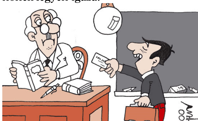
Első nap a suliban – Átnyújthatom a névjegyemet, tanár úr?

– Persze, csakis azért, hogy a tanárnőnek legyen igaza!