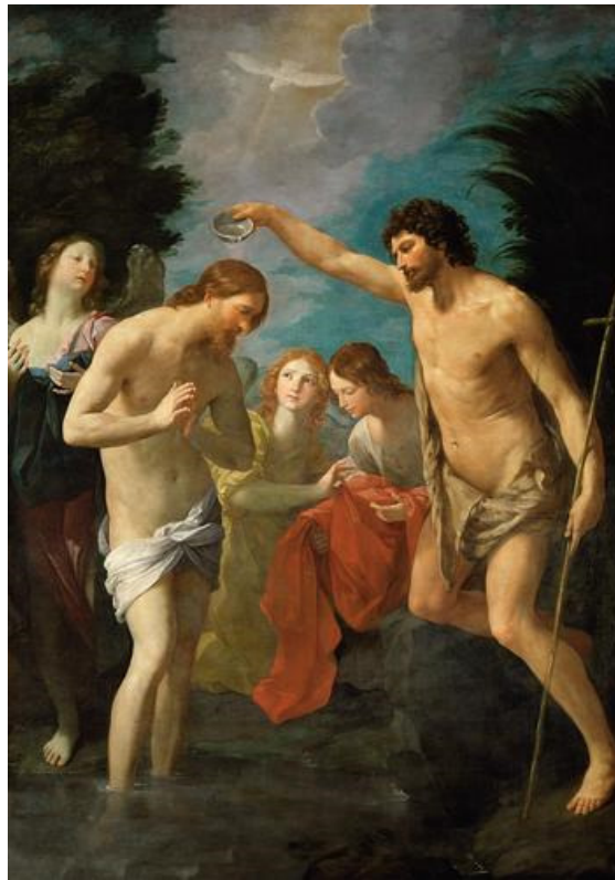
Guido Reni: Krisztus keresztelése

bennünket is gyermekekévé fogadott, és éljünk úgy, hogy rólunk is elmondhassa Krisztus: íme az én szeretett gyermekem, akiben kedvem telik.