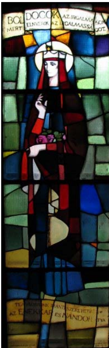
Szt. Erzsébet templomunk üvegablakán