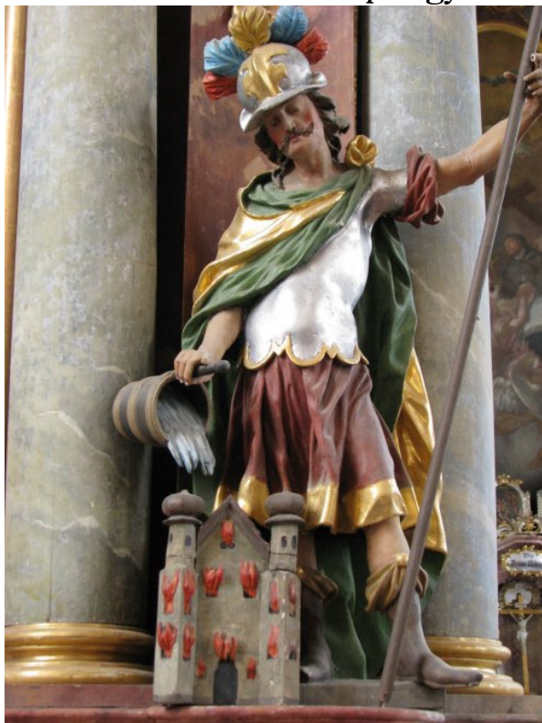
Szt. Flórián, Thürntenning

Főleg Ausztriában, Bajorországban és Magyarországon tisztelik. Bajorországban nem láttam olyan templomot, amelyikben ne lett volna Szt. Flórián-kép vagy -szobor.