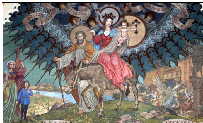
A szondi utcai Szt. Család templom oltárképe